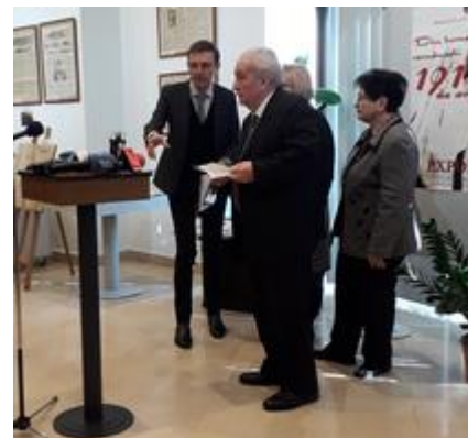
Imagine de la evenimentul de joi

"Multă lume ar spune că presa nu e chiar o latură a culturii înalte pentru că nu reprezintă literatura de vână puternică și nici de cercetare științifică de prim rang. Dar fără presă, cultura românească modernă e de neimaginat. Presa are o vechime de 191 de ani. Dar ea e mult mai veche de fapt. Presa înseamnă "veste". În italiană, "aviso". Iar "avisi" circulau pe acest teritoriu încă de dinainte de domnia lui Mihai Viteazu. Circulau foi volante care anunțau întâmplări din Europa creștină", a spus președintele Academiei, Ioan Aurel Pop.